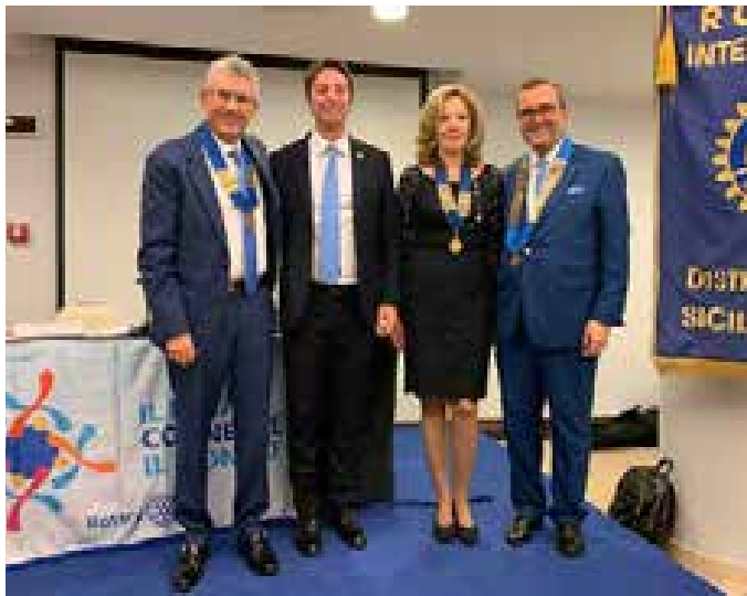
Siracusa Ortigia e Siracusa Monti Climiti