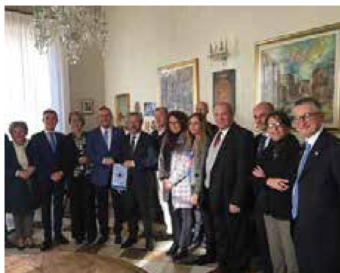
Caltanissetta. Incontro al municipio