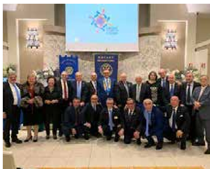
Valle del Salso