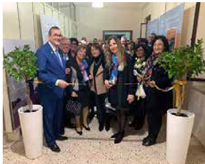
Comiso. Progetto Rotary Foundation