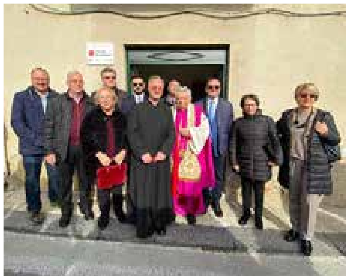
San Cataldo. Inaugurazione centro Caritas