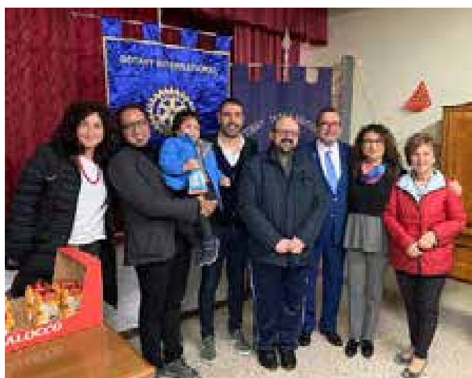
Caltanissetta. E-Club. Doni ai bambini del San Giuseppe