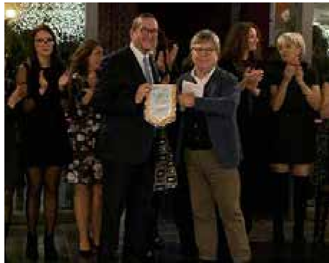
Siracusa. Award oncologia