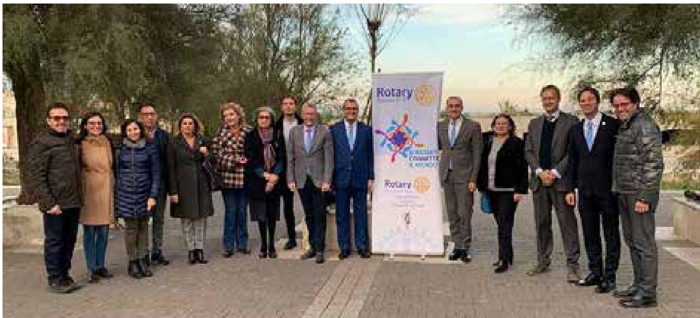
Siracusa Ortigia. Piantumazione