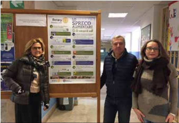
Mazara del Vallo