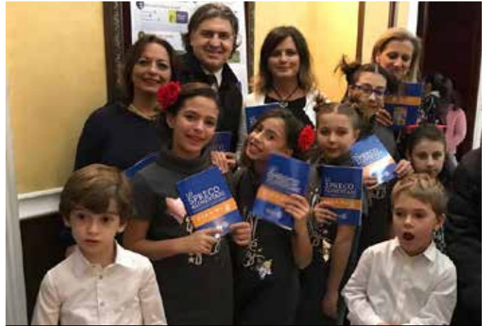
Mazara del Vallo